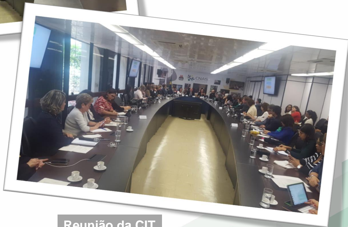
Reunião da CIT