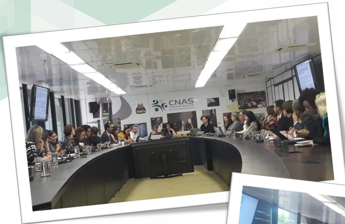
Reunião do Fonseas